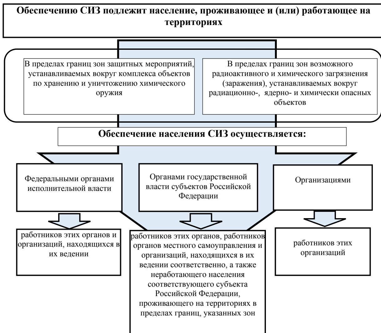
Рисунок 2.3.1 – Порядок обеспечения населения СИЗ

Накопление запасов (резервов) СИЗ осуществляется заблаговременно в мирное время федеральными органами исполнительной власти, органами исполнительной власти субъектов Российской Федерации и организациями с учётом факторов риска возникновения чрезвычайных ситуаций техногенного характера, представляющих непосредственную угрозу жизни и здоровью населения (рисунок 2.3.2).